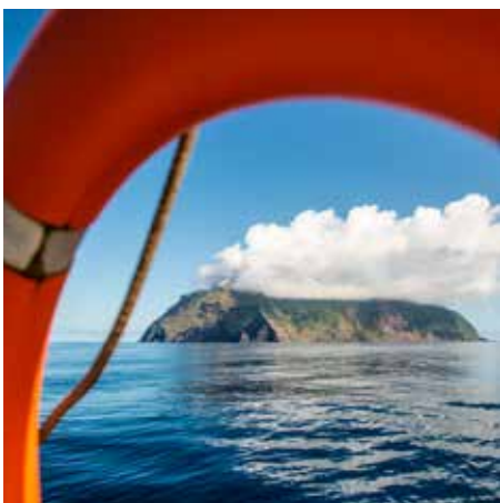
Ilha do Corvo