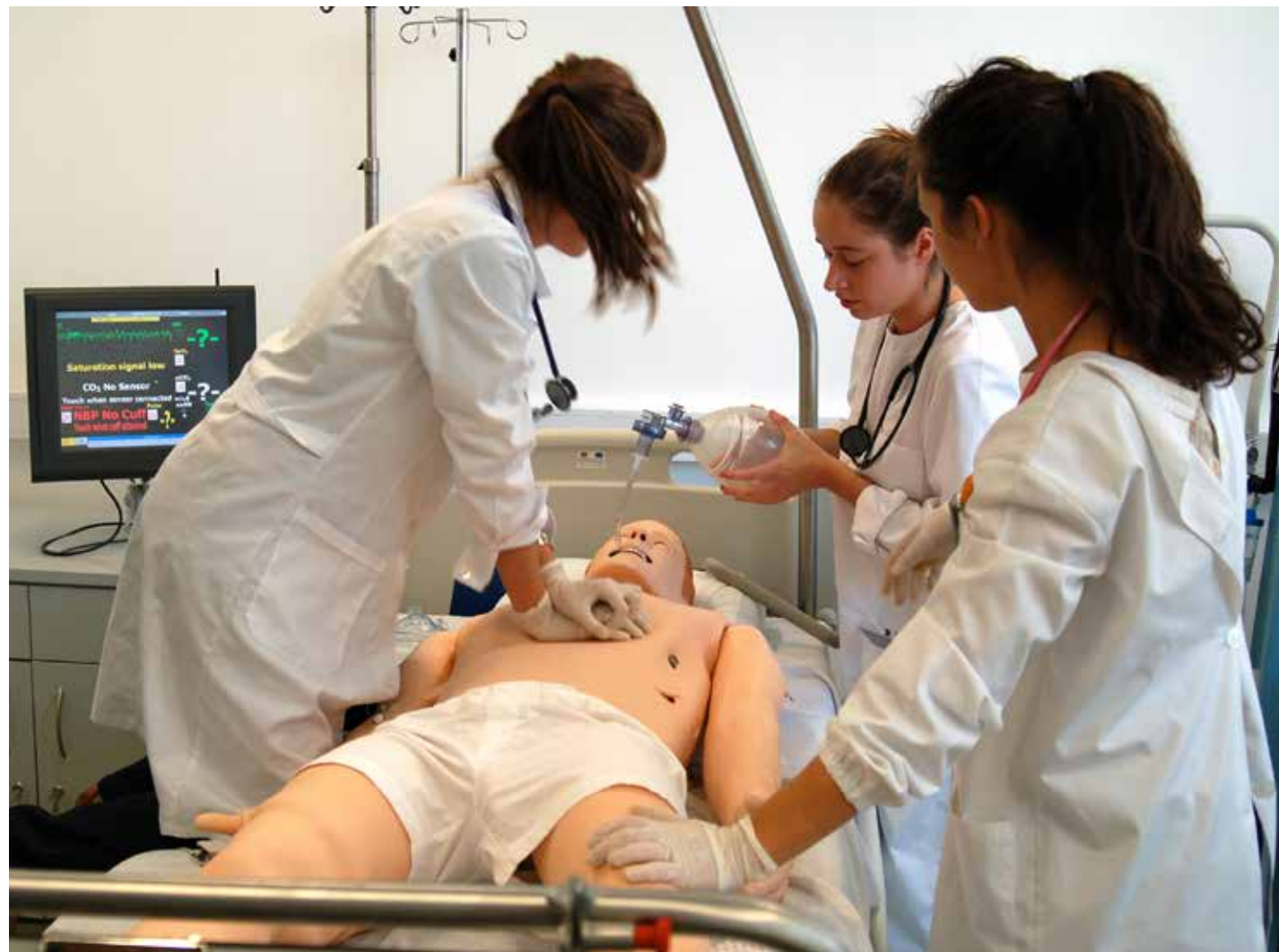
Laboratório de Competências (LaC)

O desafio de continuar a ser uma escola com ensino de ciências da saúde, medicina, ciências farmacêuticas, ciências biomédicas, biomedicina e optometria com elevada qualidade, garantindo aos estudantes que nos escolhem, não só as melhores oportunidades educativas num ambiente saudável e de bom relacionamento e convivência, mas também, uma aprendizagem dos valores humanos que são indissociáveis da prática da arte da medicina tanto no trabalho em equipa, como na relação de suporte, atenção, dedicação e respeito, que devemos ter para com o doente que nos procura, quase sempre, numa situação de fragilidade. Ao mesmo tempo, contribuir para o desenvolvimento qualitativo da saúde em Portugal, com particular atenção e incidências na região em que estamos inseridos (Interior Centro de Portugal), bem como, para a Investigação e Inovação em Saúde. Para a concretização destes objetivos contamos sempre com o trabalho, dedicação e entrega, de todos os profissionais que integram a Faculdade de Ciências da Saúde, pois sem o exemplo de profissionalismo e humanismo de cada um não seria possível a concretização destes objetivos.