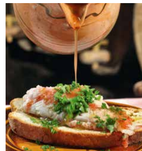
Prato Típico - Peixe

9 ilhas esplêndidas ao alcance de todos. Paisagens deslumbrantes, gastronomia de comer e chorar por mais e uma cultura rica e diversificada, onde a cidade de Angra do Heroísmo, na ilha Terceira, e a Paisagem da Cultura da Vinha, na ilha do Pico, são Património Mundial da Unesco