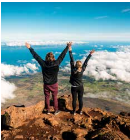
Ilha do Pico - Montanha