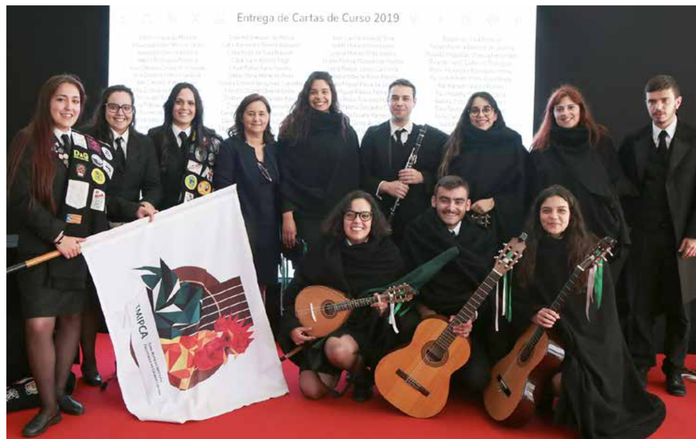
Presidente do IPCA com a Tuna Mista do IPCA na cerimónia de Entrega de Cartas

Quando pensamos o futuro temos de considerar diversos eixos, eixos estratégicos que se interligam entre si. Afirmar e consolidar o IPCA, deu-se a diversos níveis, no crescimento da sua oferta formativa, a expansão a outros concelhos, sempre norteados com a preocupação de responder as necessidades da região e sempre em estreita colaboração com o te-