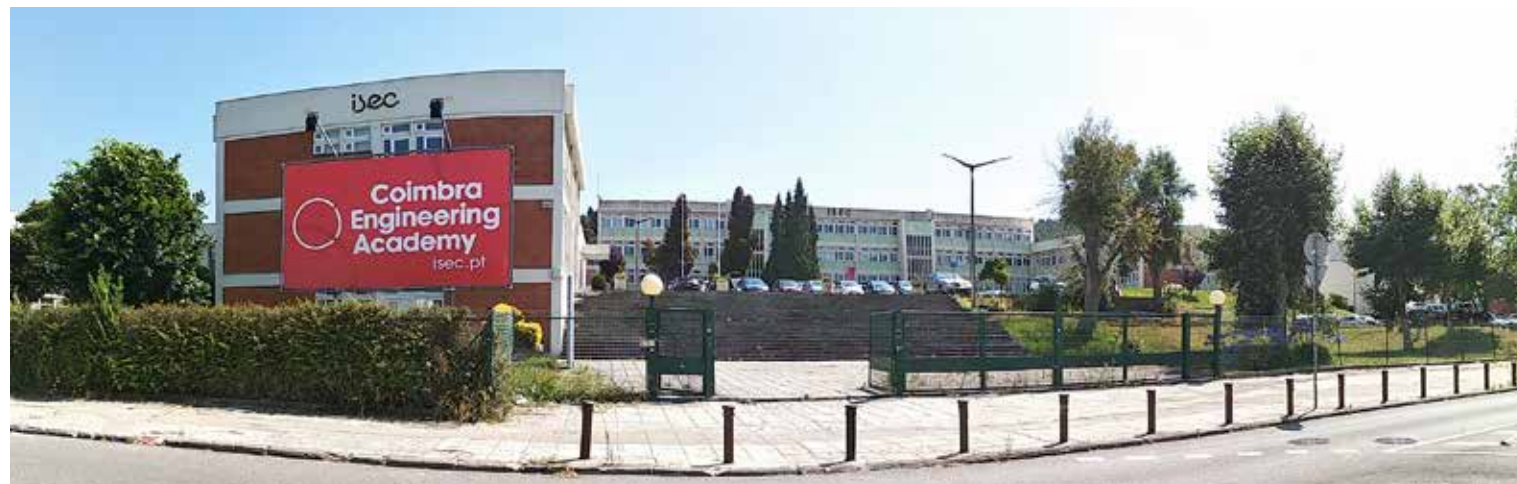
O ISEC tem uma vocação genética para trabalhar com as empresas: são inúmeros os projetos com aplicação prática