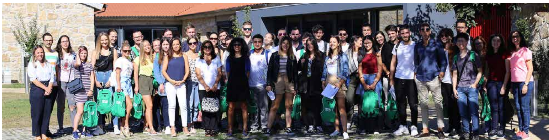
Grupo de alunos do IPCA

cido empresarial. O ano de 2019 é particularmente importante dado consolidarmos a nossa estratégia para a investigação, inovação e transferência de conhecimento, com a aprovação de centros de investigação próprios reconhecidos e financiados pela FCT, nas nossas áreas principais de intervenção, que potenciam a nossa capacidade de captação de financiamento externo.