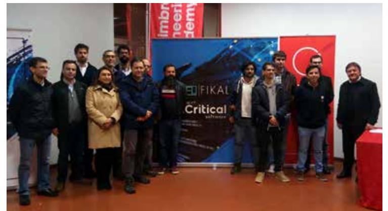
Equipa de trabalho no Fikalab