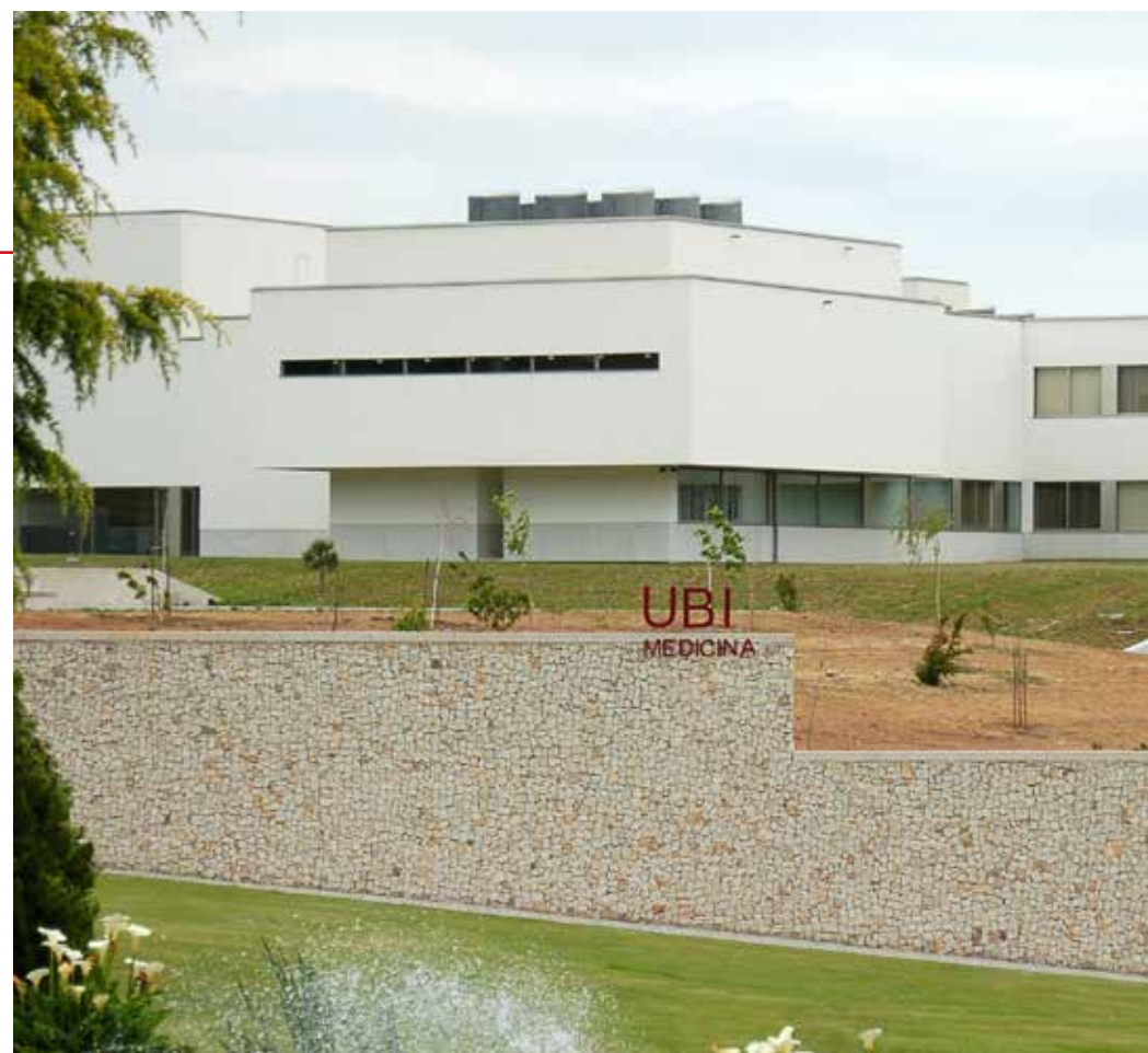
Edifício da Faculdade das Ciências da Saúde da Universidade da Beira Interior

Considero que a principal aprendizagem a retirar desta realidade que nos encontramos a viver, diz respeito ao fator imprevisibilidade. Ficamos todos com a noção que não existe controlo sobre este tipo de situações, elas aparecem, ameaçam e desafiam-nos sem qualquer aviso prévio. Isto obriga-nos a refletir e concluir que temos de estar sempre preparados para agir em situações de crise, sem vacilar temos de enfrentar um cenário de sobrecarga de trabalho e muita tensão. Tratando-se de uma epidemia que coloca em risco a saúde de toda a população e com uma rápida disseminação da mesma através de contágio, os profissionais de saúde são forçados a colocar em prática todas as suas competências de resiliência e resolução de problemas, assumindo neste caso adicionalmente o risco associado à exposição individual. Também neste contexto é essencial colocar em ação as softskills desenvolvidas, tais como, empatia, comunicação, atitude positiva, inteligência emocional e a capacidade de trabalho em equipa num contexto de grande complexidade ética que também importa desenvolver.