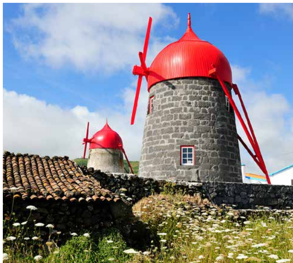
Ilha Graciosa - Moinho

A ATA é uma das entidades subscritoras da "Cartilha da Sustentabilidade dos Açores" (1) que visa apoiar a adoção dos princípios do Desenvolvimento Sustentável de forma inclusiva e abrangente nos diversos sectores da sociedade.