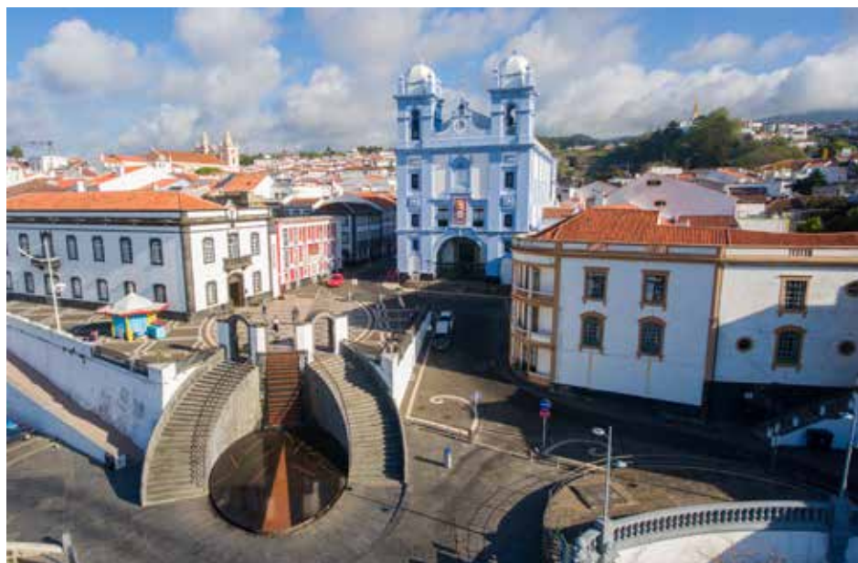
Ilha Terceira - Pátio da Alfândega (Angra do Heroísmo)

1ª Cartilha de Sustentabilidade dos Açores tem como principal objetivo ser um fórum de reflexão sobre como promover um desenvolvimento sustentável nos Açores, de forma transsetorial e em todo o arquipélago. Tem ainda como objetivos adicionais: