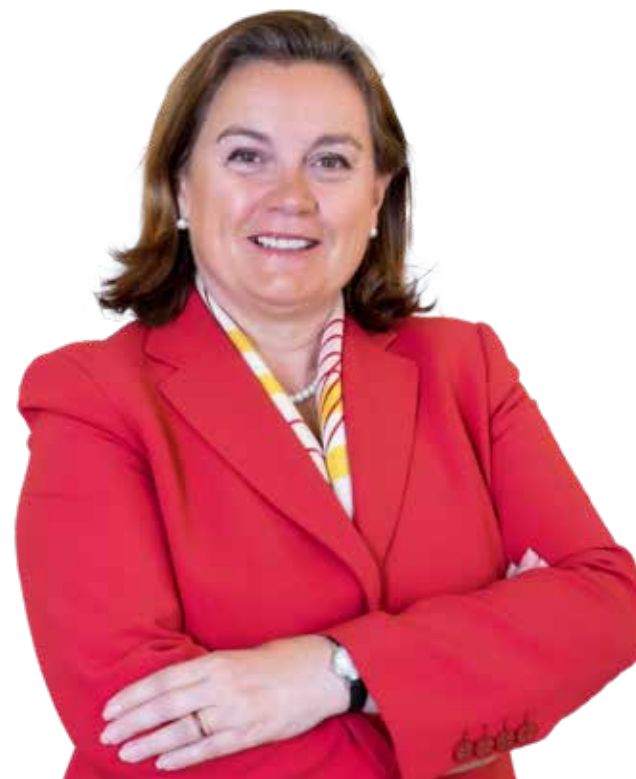
Ana Paula Zacarias, Secretária de Estado dos Assuntos Europeus

Relativamente à Europa, à família europeia, além de termos retomado a importância da políticas públicas, a importância dos mecanismos de solidariedade, um dos grandes desafios atuais é como enfrentar a situação económica em que nos encontramos: sermos capazes de ter uma cooperação intensa para evitar a propagação do vírus, conseguirmos assegurar o fornecimento do equipamento médico e de proteção individual; conseguirmos promover a investigação relacionadas com diagnóstico, terapia e na