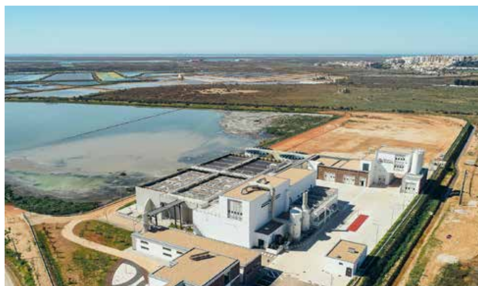
ETAR de Faro / Olhão e Sistema Elevatório de Olhão Projetos PO SEUR - Contribuição Fundo de Coesão: 14.155.603,33 €