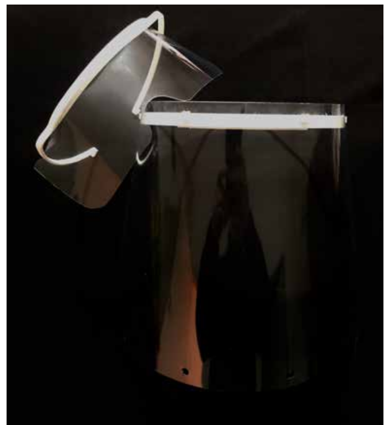
Os óculos e viseira produzidos pelo ISEC