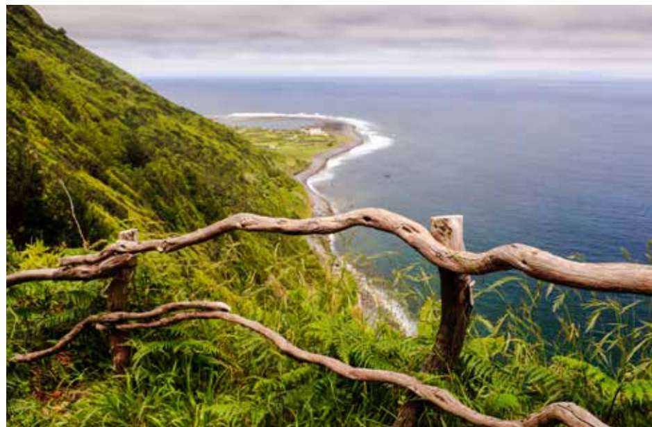
Ilha de S. Jorge - Fajã da Caldeira do Santo Cristo

Estas características são do conhecimento das grandes marcas e dos diversos grupos empresariais, que naturalmente, analisam as motivações dos seus clientes. Temos verificado um interesse crescente de determinadas marcas e grupos empresariais em associarem-se ao nosso destino, tentando aproveitar a nossa marca de sustentabilidade.