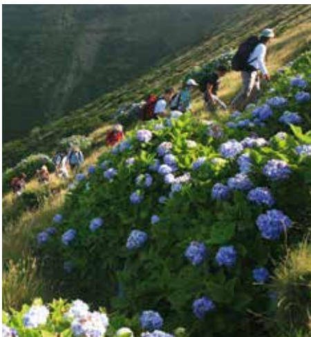
Ilha do Faial - Caldeirão

Lagoa das Sete Cidades e a Paisagem Vulcânica da Ilha do Pico, Maravilhas Naturais de Portugal.