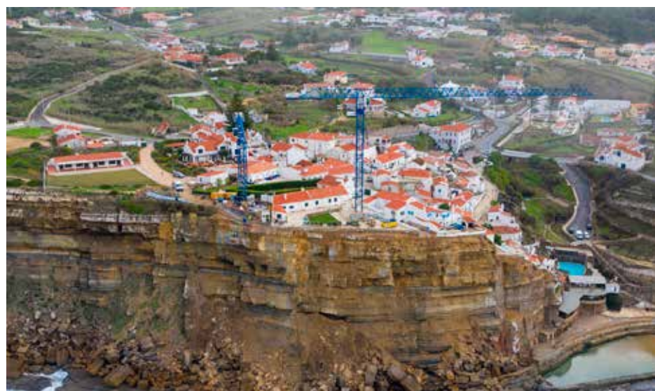
Minimização do risco nas arribas das praias do Magoito, Azenhas do Mar e S. Julião Projetos PO SEUR - Contribuição Fundo de Coesão: 3.044.112,55 €