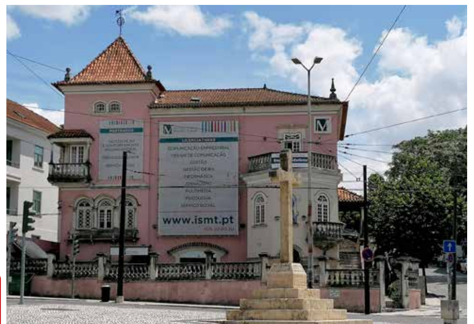
Edifício sede do Instituto Superior Miguel Torga no coração da alta de Coimbra

Existe também uma procura de jovens de países da Europa Central, porque Portugal é mais compatível com o seu poder de compra e pela qualidade do ensino no nosso país, reconhecido internacionalmente. Esta é uma afirmação da nossa cultura, mas também é esse o papel do ensino.