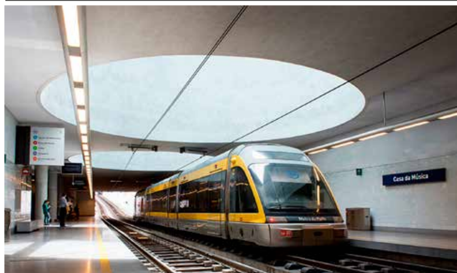
Extensão do Metro do Porto: Linha Rosa (Casa da Música – São Bento) e Linha Amarela (Santo Ovídio - Vila D'Este) 2 Grandes Projetos PO SEUR aprovados pela Comissão Europeia - Contribuição Fundo de Coesão: 107.000.000,00 €