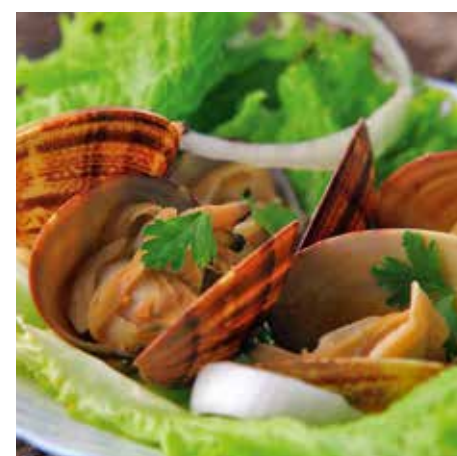
Prato Típico - Amêijoas