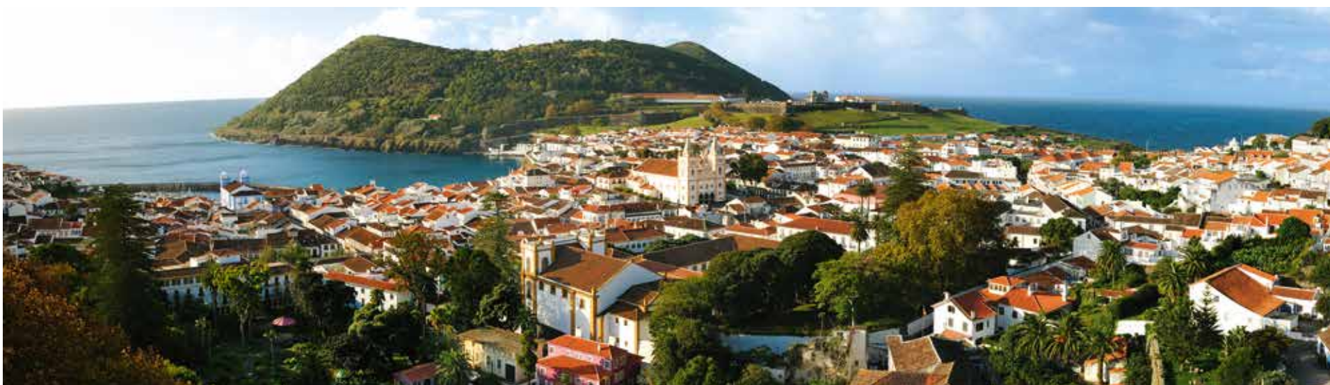
Ilha Terceira - Monte Brasil (Angra do Heroísmo)

Estas nove ilhas atlânticas proporcionam momentos de aventura, adrenalina e lazer havendo uma panóplia de possibilidades de actividades de acordo com os interesses de cada corajosos participantes.