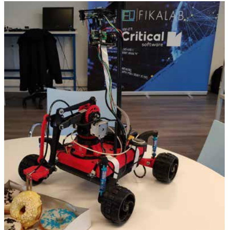
O Fikalab ISEC é o laboratório de criatividade e experimentação que o ISEC montou em parceria com a Critical Software

Como disse Einstein, “É na crise que nascem as invenções, os descobrimentos e as grandes estratégias. Quem supera a crise, supera-se a si mesmo.” O carimbo de excelência do ISEC já era a grande inserção dos seus estudantes no mercado de trabalho. A partir de agora, será também o facto de sermos a escola de engenharia em Portugal que melhor recriou o seu ensino para, quer nas plataformas digitais, quer nos seus laboratórios, formar os engenheiros do futuro.