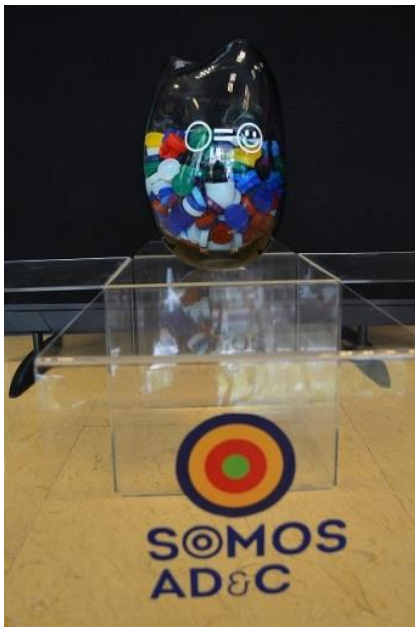
Imagem da campanha e recipiente em vidro para recolha das tampas de plástico.

A AD&C, no âmbito das ações de responsabilidade social e ambiental, associou-se à campanha de recolha de tampas de plástico, promovida pela Cooperativa de Reabilitação, Educação e Animação para a Comunidade Integrada do Concelho de Loures (CREACIL).